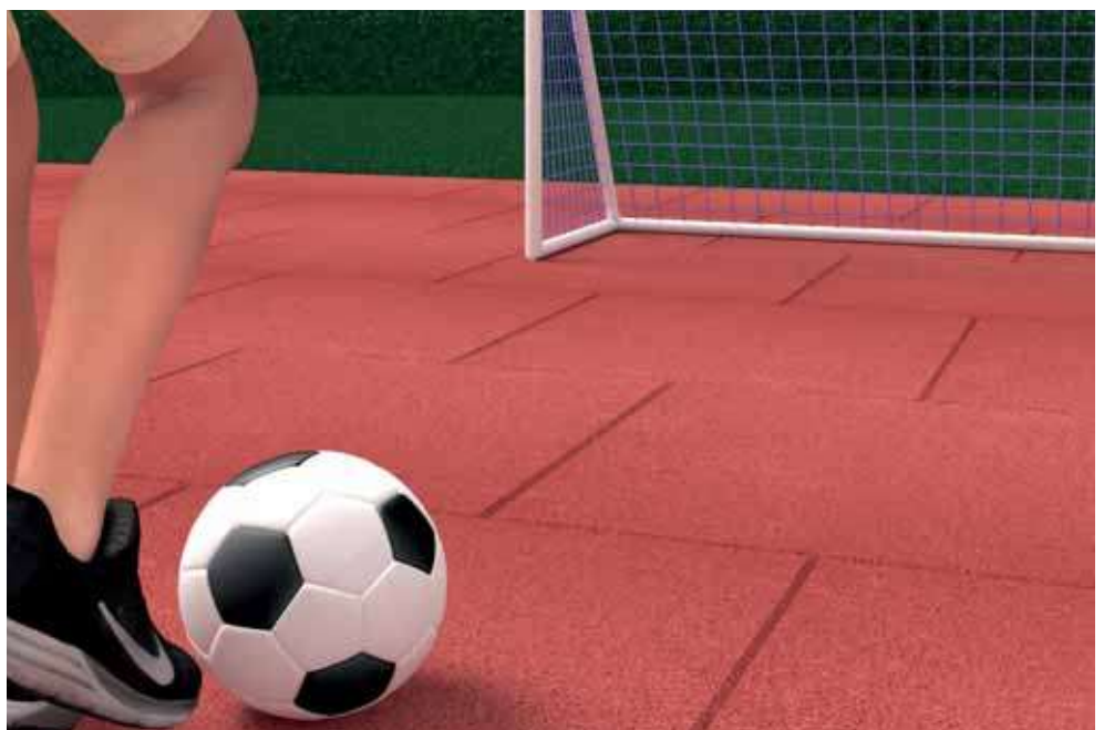
Vollstruktur-Platten mit einem Grad der Elastizität, die sich dem erforderlichen Aufprall des Balles auf dem Feld anpasst.